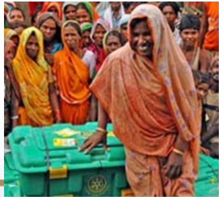
Compra y envío de una ShelterBox a un área de desastre