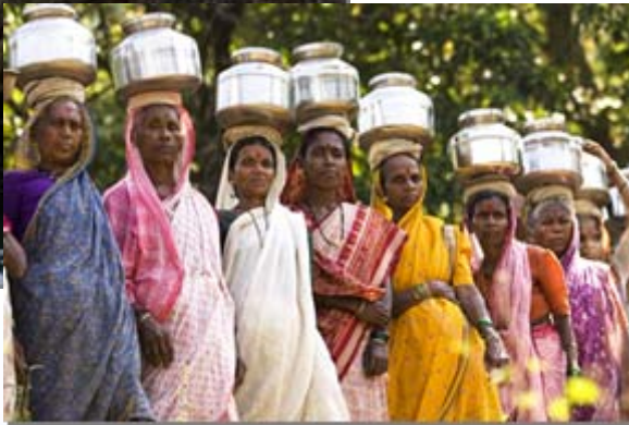
Proyectos sostenibles de agua potable