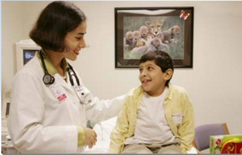
Financiamiento de viajes de voluntarios