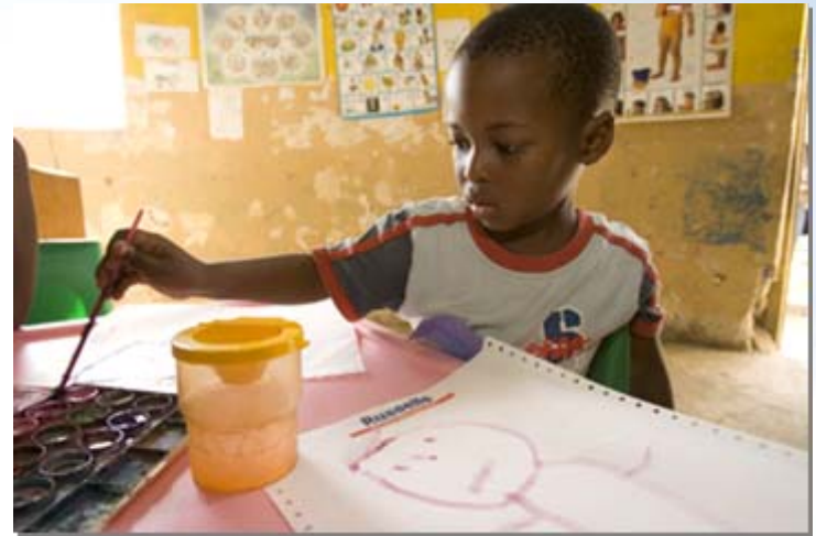
Donación de artículos escolares